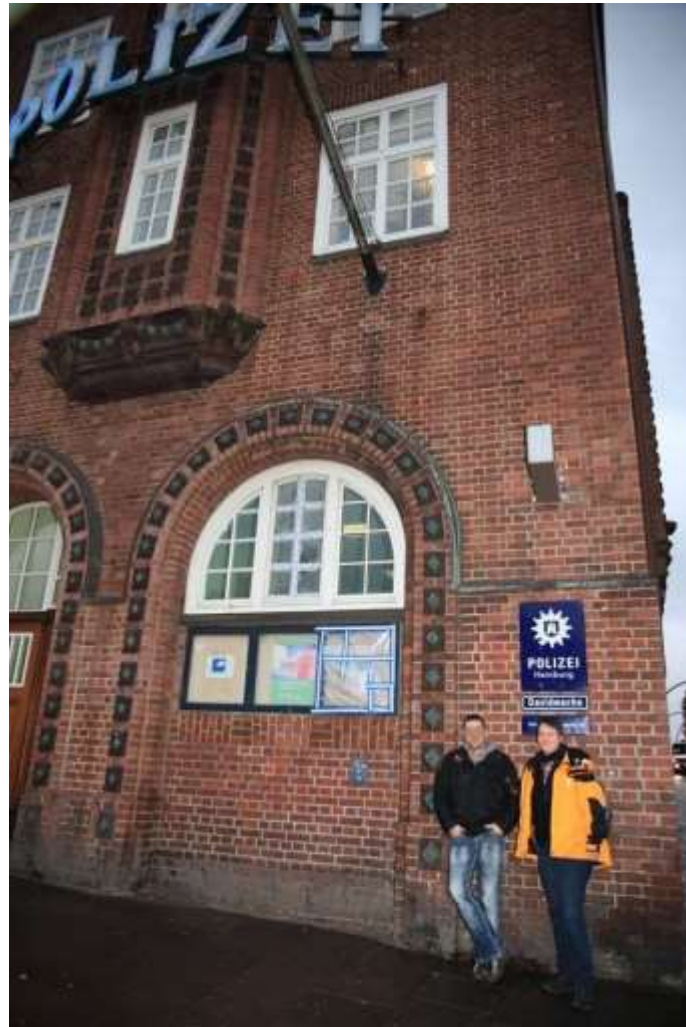
(Ich und der am schwersten verletzte Polizist vor der Davidwache)

Dann war es auch schon an der Zeit, meinen Zug nach Bremen zu nehmen und mich zu verabschieden. Danke an alle Beteiligten, dass mir dieses Gespräch ermöglicht wurde, und danke den Polizeibeamten für ihre Offenheit. Das hat mir wirklich viel bedeutet.