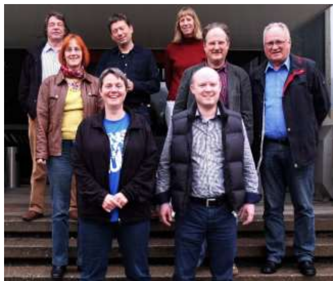
Workshops machen Spaß